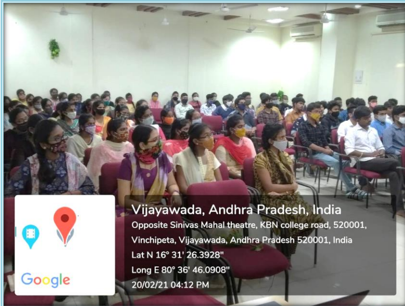
Students at the Guest Lecture